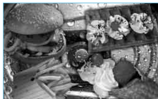
Une alimentation trop déséquilibrée.

Des actions d'information et d'éducation nutritionnelle, d'incitation à la pra-