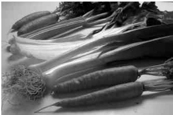
La chaîne alimentaire également atteinte par la contamination.

Et parce qu'il regrette l'insuffisance des calculs « qui ne convainquent personne », il conclut que « seuls les registres et les enquêtes épidémiolo-