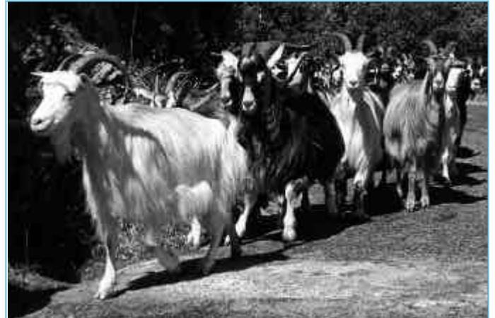
Des troupeaux contaminés par le nuage radioactif ?

L'Office de Protection contre les Rayonnements Ionisants (OPRI) en collaboration avec